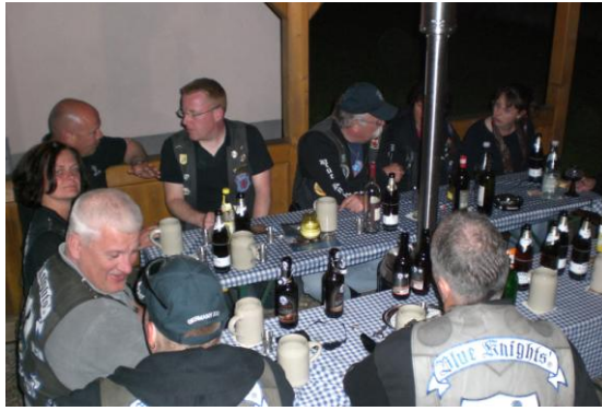
Links neben Pauli der Schotte, hinten rechts die Chefin

So mancher (der eine mehr, der andere weniger) konnte seine Englischkenntnisse an den Mann/die Frau bringen und es kam zu einem regen Gedankenaustausch, der zu fortgeschrittener Stunde in folgenden Aussagen gipfelte: